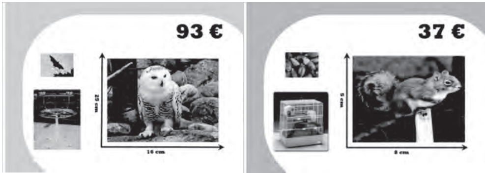
FIGURES 2 I 3 Prova conversacional